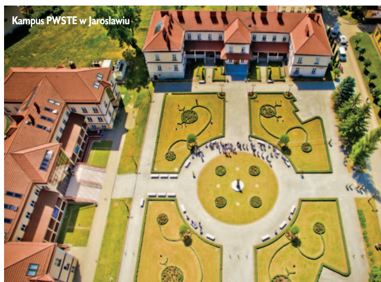
Kampus PWSTE w Jarosławiu

Akademii Rolniczej w Lublinie. W 2009 r. był p. o. kierownika Katedry Agrometeorologii Wydziału Agrobiotechnologii Uniwersytetu Przyrodniczego w Lublinie, od 1 października 2012 r. do 31 grudnia 2013 r. był kierownikiem Zakładu Ochrony i Kształtowania Środowiska Wydziału Biogospodarki w Zamościu Uniwersytetu Przyrodniczego w Lublinie. Funkcję rektora Uczelni Państwowej im. Szymona Szymonowica w Zamościu pełni od 2016 r.