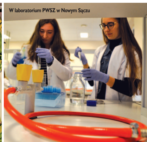
W laboratorium PWSZ w Nowym Sączu